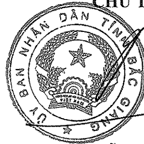
Nguyễn Văn Linh